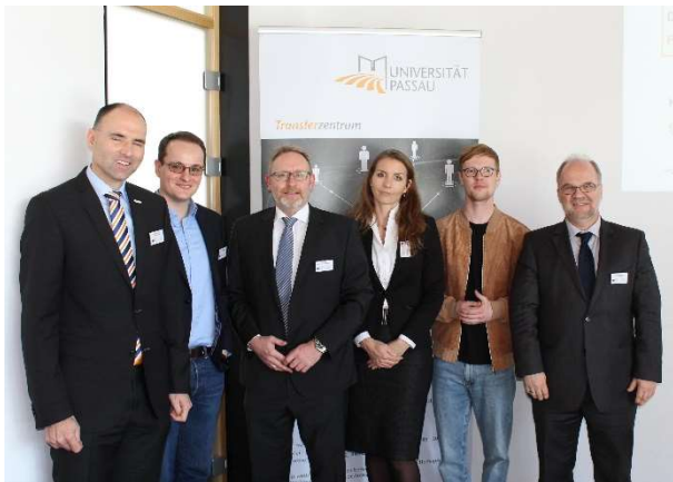
Referent/innen des WTT-Formats „Datenschutzbeauftragter nach der DSGVO“, 08.03.2018, Europahaus Freyung

Logo des 2. Südböhmisch-Niederbayerischen Transferkongresses, Universität Passau, 19. und 20. September 2018